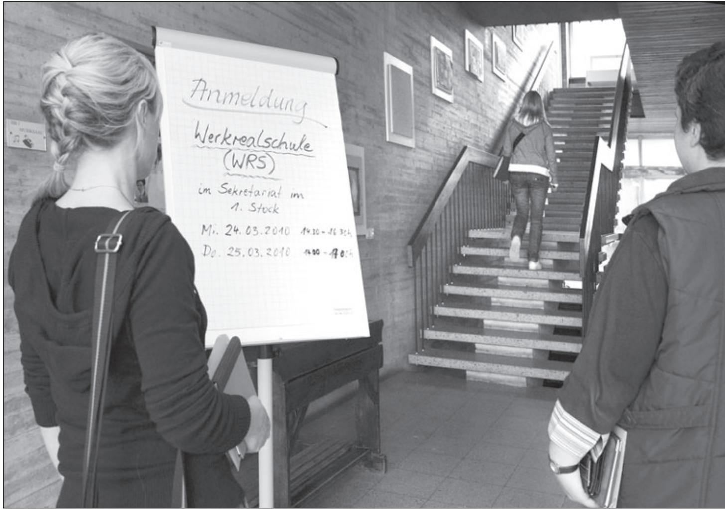
Fünftklässler-Anmeldung letzte Woche in Winterbach: Hier geht's lang zur neuen Werkrealschule.

Für Klasse fünf der Hauptschule in Geradstetten wurden 14 Kinder angemeldet, bei vier von ihnen steht noch das Beratungsverfahren an. Eingedenk der noch offenen Situation für sechs Grunbacher Grundschüler könnte es sein, dass die Hauptschule Geradstetten mit einer vollen Klasse fünf ins Schuljahr 2010/11 geht. 16 Schüler/innen sind dafür nötig. Blicke die Zahl jedoch unter 16, gibt es für ein Jahr eine Klasse mit weniger als 16 Kindern, im nächsten Jahr aber müssten die neue Klasse fünf und die Sechstklässler der diesjährigen